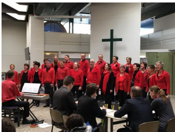
Lighthouse uit Helmond tijdens hun uitvoering

Het festival wordt tweejaarlijks georganiseerd door Code-Music. De achtste editie zal plaatsvinden op 9 maart 2019. ( bron: persbericht Code-Music 12-3-2017 )