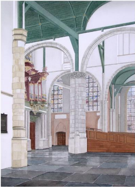
St. Janskerk in Gouda

programmeren in het totaalprogramma van deze dagen. Ook kunnen zij op hun eigen wijze een lokaal of regionaal startschot geven aan de Nationale Orgeldag 2017, waarbij het orgel een nadrukkelijke rol kan krijgen in het culturele leven. Ook samenspel met andere muziekinstrumenten geeft een versterkende rol aan het orgel. Muziek zal samenbindend werken! Het landelijke startschot van de Nationale Orgeldag 2017 wordt gegeven in de Sint-Janskerk in Maastricht. Dit op initiatief van en in nauwe samenwerking met de Stichting Samenwerkende Orgelvrienden Limburg (SOL). Er zijn korte orgelbespelingen en een lezing.