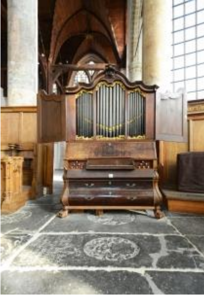
Onderhorst-kabinetorgel in de Oude Kerk