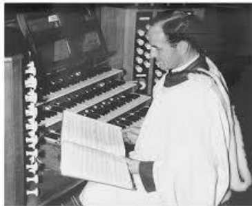
SIR DAVID WILLCOCKS AT THE HERTFORDS CHURCH ORGAN AT WILLCOCKS CAROLS BY SIR DAVID

Willcocks is vooral bekend van de vele arrangementen die hij maakte van traditionele Britse Christmas Carols.