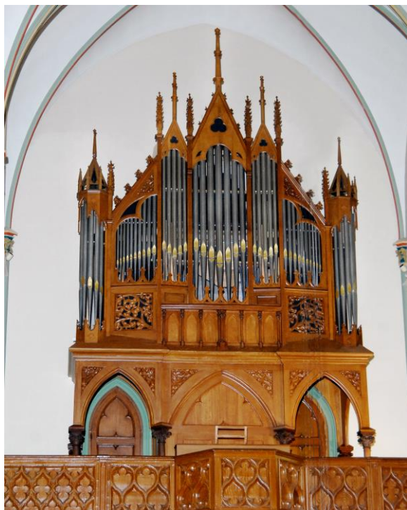
Mitterreither/Van den Brink orgel, H. Laurentiuskerk, Voorschoten.

Op zondag 27 september a.s. wordt het geheel gereconstrueerde en gerestaurerde orgel van de H. Laurentiuskerk te Voorschoten in gebruik genomen. Het is het op twee na oudste orgel van het bisdom Rotterdam. Om meerdere redenen is het een bijzonder instrument. Niet alleen omdat het van alle orgels in het bisdom Rotterdam het grootste aantal 18e-eeuwse pijpen heeft, maar ook omdat het een vroeg voorbeeld is van een orgel met vrij staande mechanische speeltafel. Uniek voor Nederland is de vondst van een deksel van een pijp (toon fis o van het register Holpijp 8' op het hoofdwerk) met aan de binnenzijde een gravure van een personeelslid van orgelmaker Matthias van den Brink.